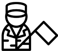
Punto 3 Fin del conflicto

En esta sección, encuentra la información sobre las acciones que viene desarrollando esta entidad para dar cumplimiento al Plan Marco de Implementación, organizadas por cada Punto del Acuerdo de Paz al que aportamos, los cuales son: Punto 3 del acuerdo, Fin del conflicto.