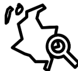
Punto 6 Implementación, verificación y refrendación

Finalmente, encuentra acciones que, aunque no son obligaciones explícitas del Acuerdo de Paz ni de los decretos reglamentarios, se han realizado en el marco de las competencias legales con el propósito de contribuir a su implementación.